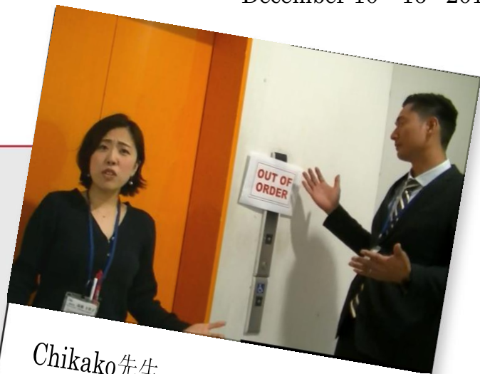
Chikako先生 John先生 サイエイ・インターナショナルおたかの森校

The elevator is out of order now. 現在、エレベーターは故障中です。